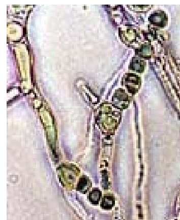
Ejemplo de una hifa fongosa bajo un microscopio

El cuerpo del hongo Armillaria está compuesto de una estructura llamada micelio, el cual es una masa enredada de largos filamentos celulares unidos; estos filamentos se llaman hifas. Las células en un tejido fúngico son similares, aunque no del todo, a las células que constituyen nuestros cuerpos. Las hifas contienen núcleos, como nuestras células, pero a diferencia de las nuestras, las hifas usualmente no están completamente separadas unas de otras. Pueden estar separadas por paredes llamadas septas, pero normalmente los septas tienen orificios que permiten la comunicación con el citoplasma de células vecinas. En algunas especies de hongos las hifas no contienen septas, y aparecen como células continuas, largas y con núcleos múltiples.