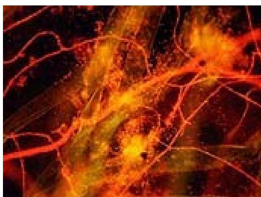
Mycorrhizae (rojo) sobre raíces (verde y amarillo)

http://www.jardineriaon.com/el-hongo-gigante-de-oregon.html