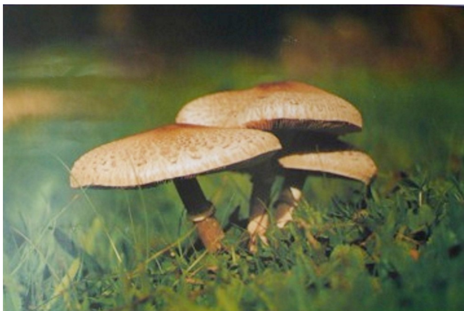
Macrolepiota permixta (Baria 1886) Pacioni 1979

Día 29 de Noviembre de 1999 ○ De 10 a 14 y de 17 a 21 horas