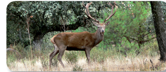
Las especies de caza mayor son muy abundantes en la zona

almacenes y casas de los mineros que aquí vivieron y trabajaron durante muchos años. Hemos de aprovechar este cerro para disfrutar de las vistas panorámicas [3] que nos brinda el sendero en este punto.