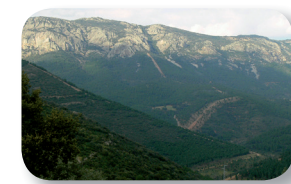
Desde el Cerrillo del Plomo tendremos unas magnificas vistas de la Sierra del Puntal

Continuamos nuestro paseo y, hacia mitad del camino, cruzaremos de nuevo el arroyo mientras seguimos descendiendo hasta llegar a un cruce, que dejaremos atrás por nuestra senda en la misma dirección y así subir al Cerrillo del Plomo, donde podremos observar las trazas de un poblado minero de época romana, así como restos de los