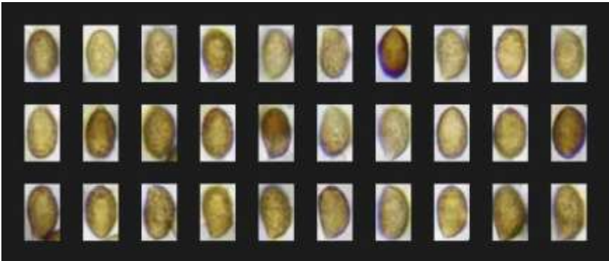
Fig. 2.6.2. Esporograma. Cortinarius strenuipes R. Henry

Carne pardo ocrácea, marmozada hacia el ápice del estípite de grisáceo, más oscura hacia la base, de olor agradable.