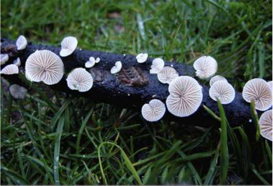
Fig. 2.3. Resupinatus applicatus (Batsch: Fr.) S. F. Gray