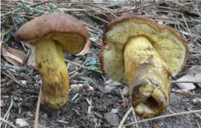
Fig 2.4. Xerocomus moravicus (Vaek) Herink