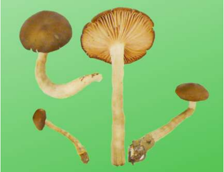
Fig 2. 1. Entoloma rhodopolium (Fr: Fr.) P. Kumm.