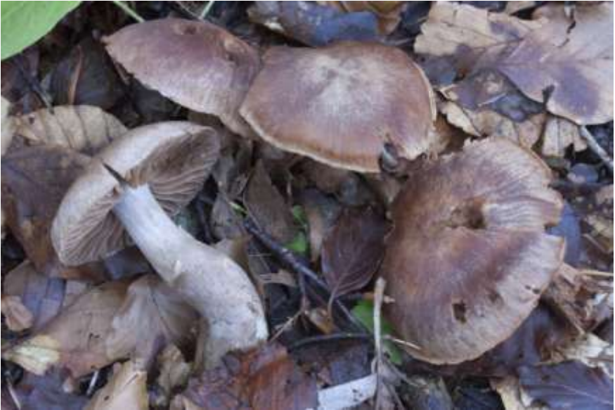
Fig.2.6.1.. Cortinarius strenuipes R. Henry