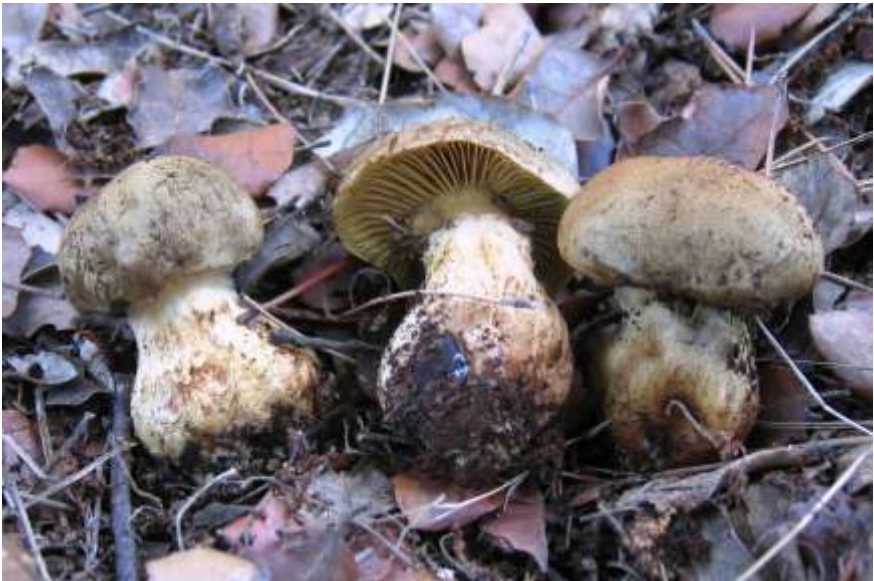
Fig. 2. 7.1. Cortinarius subcotoneus Bidaud

= Cortinarius cotoneus Fr. ss. J. E. Lange, Fl. Agar. Danica