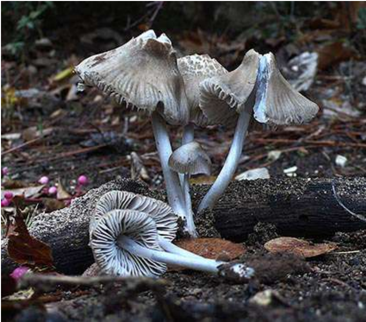
Fig. 2.2. Mycena font-queri Maire

Ejemplares recolectados en El Cantalar, Sierra de Cazorla, el 27 - 11 - 2016, UTM VH0802, depositada en el herbario particular del autor: JA - F 4182.