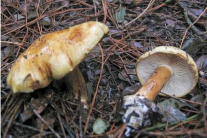
Fig. 4.8. Leucocortinarius bulbiger (Alb. & Schow. ex Fr) Sing.