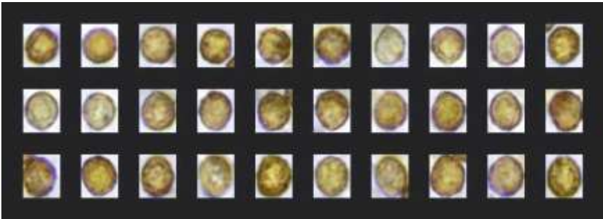
Fig.7.2. Esporograma . Cortinarius subcotoneus Bidaud

Carne crema en el píleo, olivácea marmorizada de amarillo olivácea en el pie; olor rafa-noide y sabor amarescente.