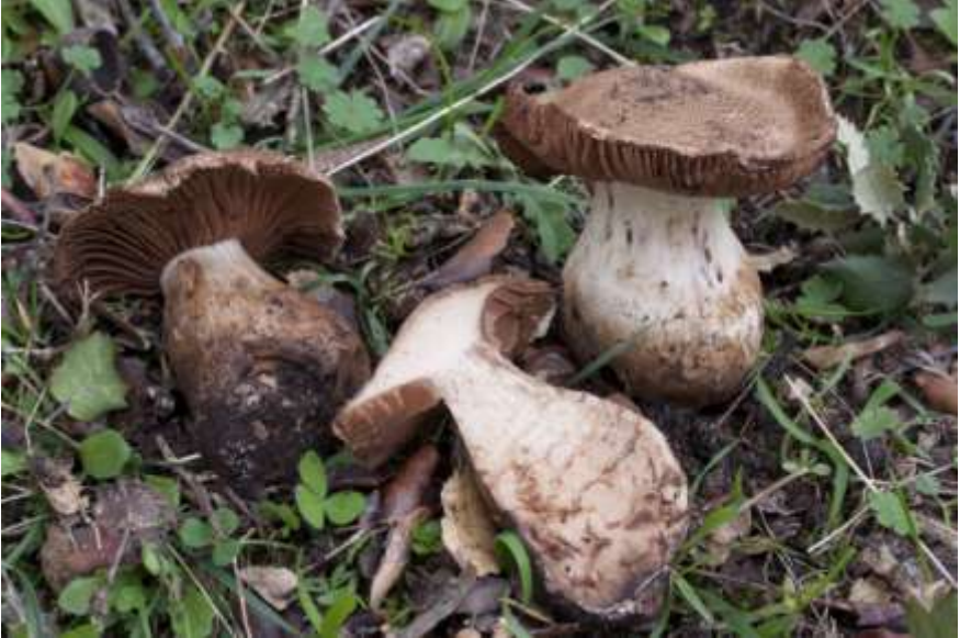
Fig. 2.5.1. Cortinarius diffractosuavis Chevassut & R. Henry

Sección. Sericeocybe (P. D. Orton) Melot