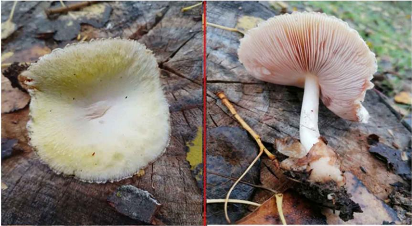
Fig. 2.5.- Volvariella bombycina var. flaviceps (Murrill) Shaffer.