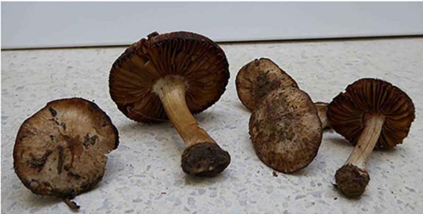
Fig. 2.1.- Inocybe pallida Velen.