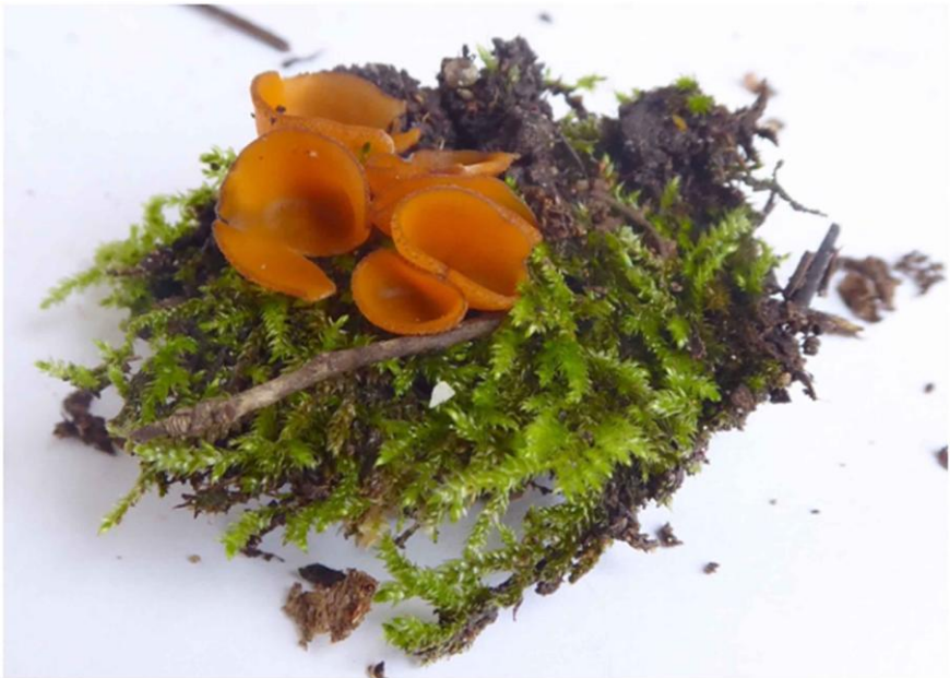
Fig. 2.3.- Pseudoleuria fibrillosa (Curry) J. Moravec.

Pseudoleuria fibrillosa (Curry) J. Moravec