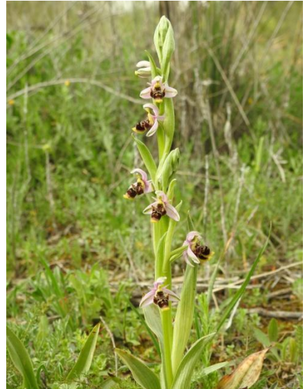
Fot. 8.7.- Ophrys santonica (Chiclana de Segura)