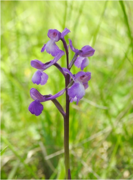
Fot.8.4.- Anacamptis x rayyana (Benatae)