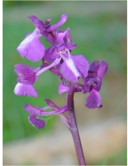
Fot. 8.5.- Anacamptis x rayyana (Orcera)

[ Anacamptis champagneuxii (Barnéoud) R.M. Bateman, Pridgeon & M.W. Chase × Anacamptis laxiflora (Lam.) R.M. Bateman, Pridgeon & M.W. Chase]