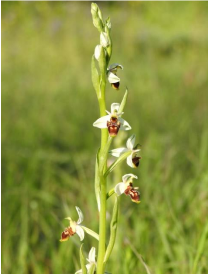
Fot.8.6.- Ophrys santonica (Santiago-Pontones)