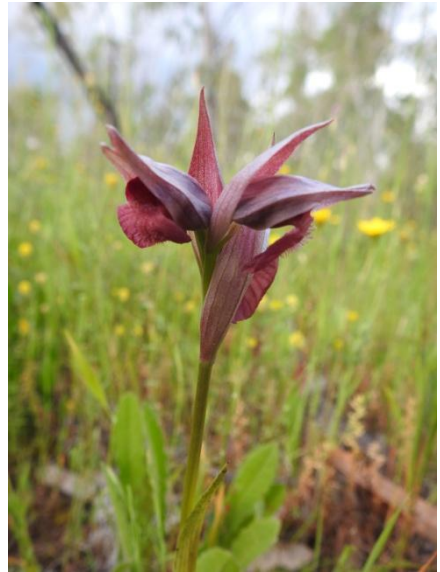
Fot. 8. 2. Serapias xrainei E.G.Camus

La población de Linares sigue apareciendo año tras año, si bien, la sequía y los fitófagos no han favorecido su crecimiento, variando el número de ejemplares en flor según el año y las condiciones ambientales.