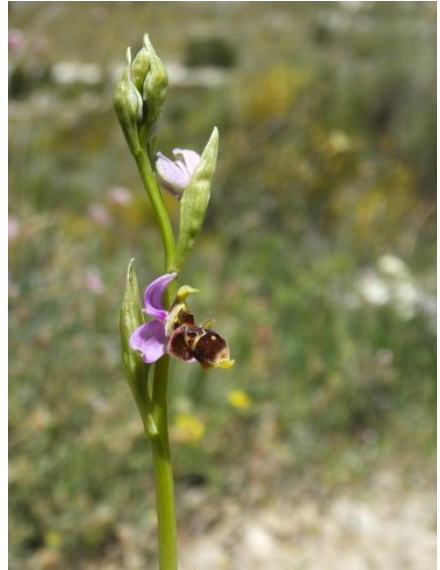
Fot. 8.9.- Ophrys santonica J.M. Mathé & Melki. (Albanchez de Mágina)

Con estas dos nuevas localizaciones para la provincia de Jaén ampliamos el área de distribución de este nototaxón.