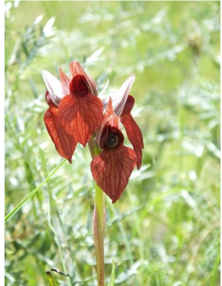
Fot. 8.1.- Serapias cordigera L.

JAÉN. Linares, La Cruz. 30SVH42. Herbazales en claros de eucaliptal de repoblación, sobre suelos ácidos. 25.04.2021. Obs. A. M. Díaz y M. Gómez.